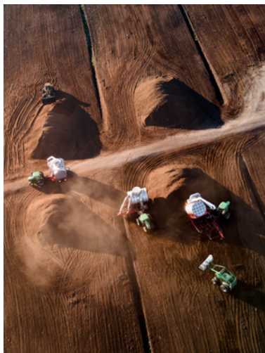
Récolte de la tourbe à Saint-Ulric, dans le Bas-Saint-Laurent.

Les œuvres de Mériol Lehmann s'intéressent à la création de nouvelles topographies rurales par les industries extractivistes. Tel que l'explore Éric Pineault dans l'essai « Morts terrains » (p. 48), le territoire québécois est encore et toujours plus ravagé par l'extraction massive qu'exige le capitalisme avancé.